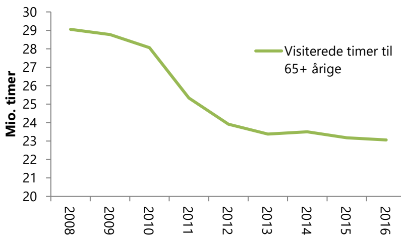
Figur 1 – Visiterede hjemmehjælpstimer for personer over 65 år om året